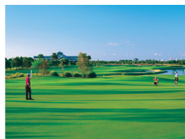
海外リゾートのゴールドコースト