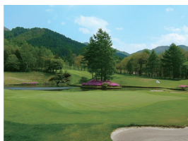
夏は避暑地のCCC野辺山へ