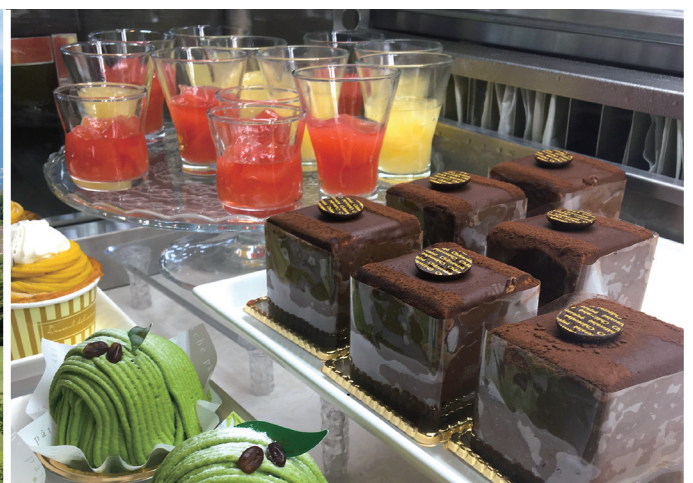
シャトレゼのスイーツビュッフェ