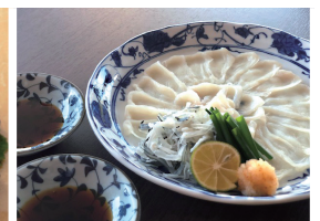
産直の河豚等 特別料理も対応