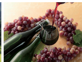
シャトレゼワイナリー直送の生ワイン