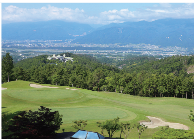
雄大な甲斐ヒルズCC